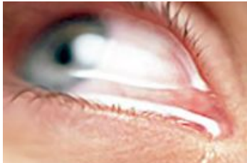
Þurrum augum fylgir jafnan tárflæði

Algengasta einkenni þurra augna er aðskotahlutstílfning og þau eru oftast verst á morgnana. Sérstaka athygli vekur að eitt megineinkenni þurra augna er aukið tárflæði og lýsir fólk því oft svo að þegar það fari út í íslenska rokið fari tárin að renna niður vangana.