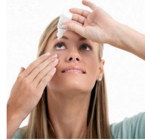
Gervitár sett í auga

Oftast er byrjað á að nota gervitár, sem fást án lyfseðils í apótekum. Forðast skal að nota dropa sem gera augu hvítari. Gervitár eru til í dropa- hlaup- og smyrslformi. Gervitárahlaup og smyrsl eru fyrst og fremst notuð fyrir svefn en þau duga lengur en venjuleg gervitár.